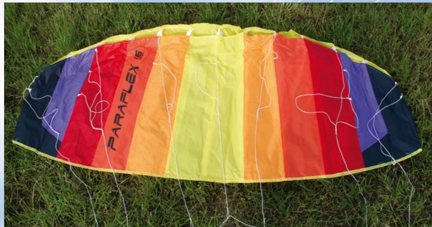
Mit der Variante Rainbow erhält man eine farbenfrohe Matte, die ihre Wirkung auch am Himmel nicht verfehlt

Die Paraflex Sport 1.6 gibt es in zwei Farbvarianten, in einer blauen und in der hier vorgestellten Rainbow-Version. Jeweils einzelne Boden- und Deckenpaneel bilden zusammen mit den Profilpaneelen die Kammern, von denen zwölf Stück den kompletten Schirm dar-