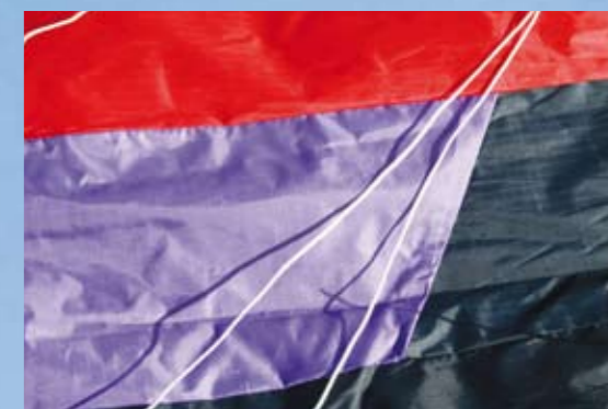
Das schlichte Design ist nähtechnisch gut umgesetzt, die Schleppkante wurde doppelt umgelegt und vernäht