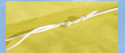
Markierungen auf der Waageschnur sorgen für präzise gesetzte Knoten