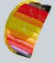
Viel Spaß für wenig Geld. Bei stärkerem Wind wird die Paraflex zum flinken Flitzer, an Handschlaufen geflogen wirkt sie noch einmal agiler

eignet sich gut für die ersten Schritte. Für einen Set-Preis von 37,50 Euro inklusive Lenkbar bietet sich somit der Schirm für alle Anfänger, Neueinsteiger, Juniorpiloten und auch Gelegenheitskiter an, die viel Spaß haben wollen, ohne sich in große Unkosten zu stürzen.