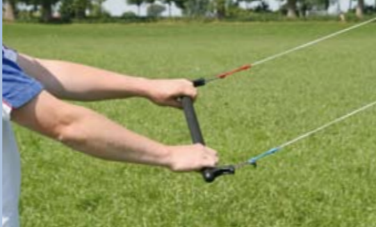
Die weich gepolsterte Lenkbar dient auch direkt zum Aufwickeln der Schnüre

Die verwendete Bogenwaage ist im Flug leicht zu erkennen, sie trägt zu den gut zu dosierenden Lenkbefehlen bei