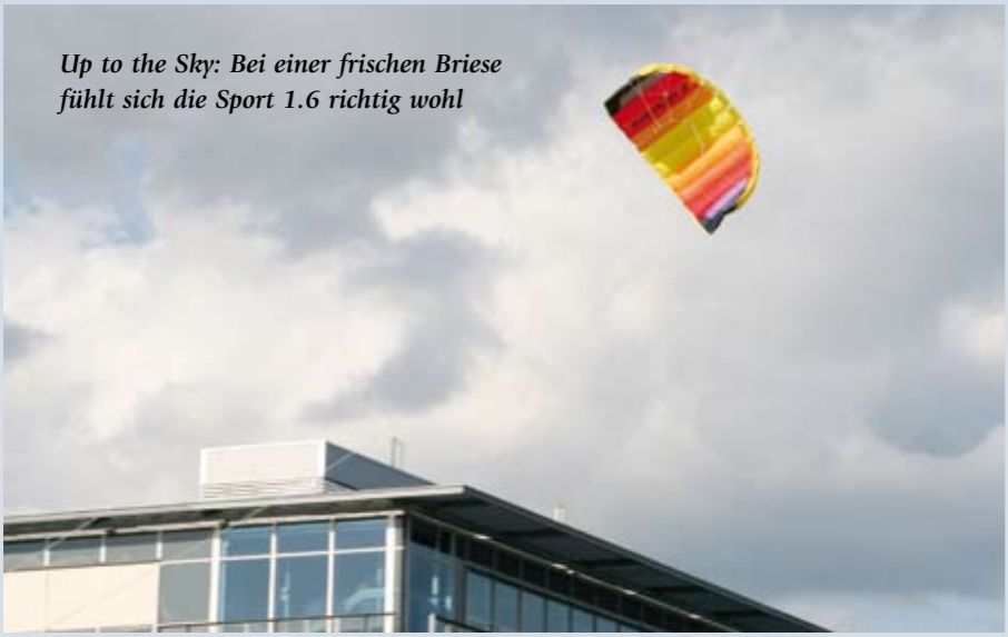
Up to the Sky: Bei einer frischen Brise fühlt sich die Sport 1.6 richtig wohl

SDD: Sie haben das Patent verkauft. Warum? Wolfgang Schimmelpfennig: Wolkenstürmer und ich haben viel Geld in den Schutz des Paraflex investiert. Diese bedurfte es eines hohen Aufwands, weil viele Firmen die Matte kopiert haben. Daher war es sinnvoll, die Rechte zu verkaufen. In Folge dessen wurde viel an der Weiterentwicklung des stablosen Lenkdrachens gearbeitet, sodass heute wesentlich leistungsstärkere als das Urmodell am Himmel zu sehen sind.