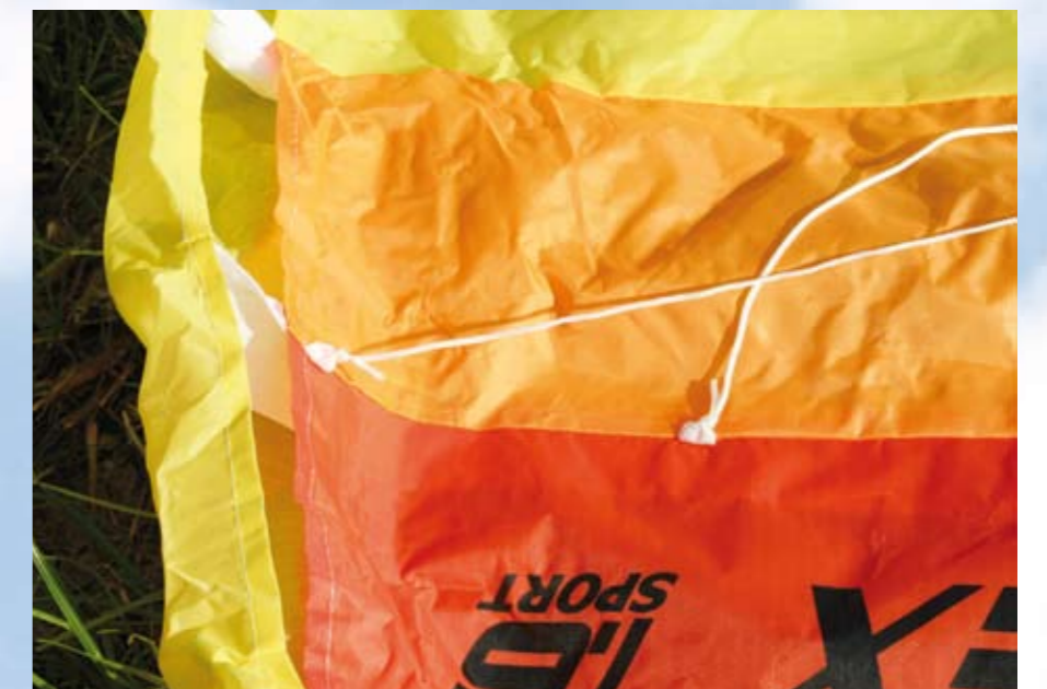
Die eingenähten Gurtbandschlaufen nehmen die einfach verknotete, ungemantelte Waage auf